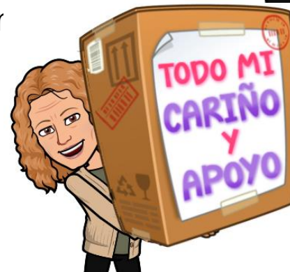
Supervisora de Trabajadoras Sociales: Barri